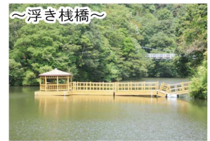
～浮き棧橋～ 浮き棧橋からは山が映える静かな湖面が眺められます。