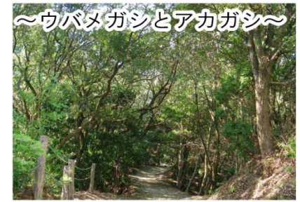
～ウバメガシとアカガシ～ 山の尾根にはウバメガシ林が広がり、山頂付近にはアカガシがあります。