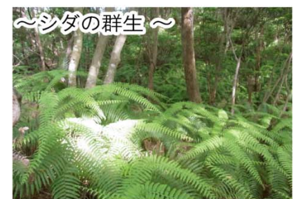
～シダの群生～ 気温と湿度等の条件がそろっているため今までに176種類のシダが見つかっています。