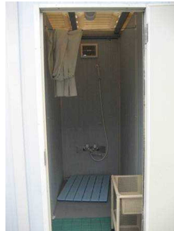
設置されたシャワールーム(写真左)とその内部(写真右)

【効果】 作業従事者に安心して働くことのできる環境を提供することなどにより、事故・災害の防止を未然に防止することが期待されます。