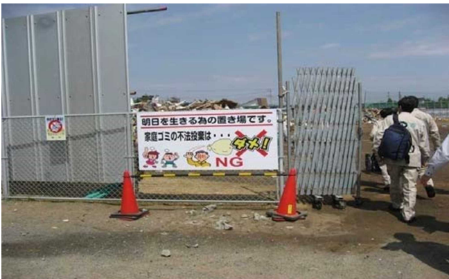
千葉県旭市仮置場ゲート入口の注意看板不法投棄禁止の注意喚起