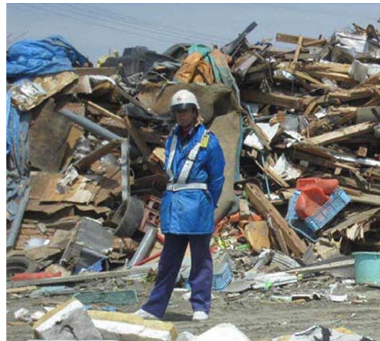
盗難防止のためのガードマン