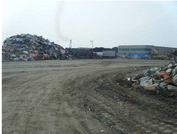
東松島市の自動車用タイヤの仮置場

【取組】 宮城県東松島市では、仮置場における自動車用タイヤの搬出をほぼ毎日行い、保管期間を最小限に留めることにより、蚊の発生防止の取組を行っています。