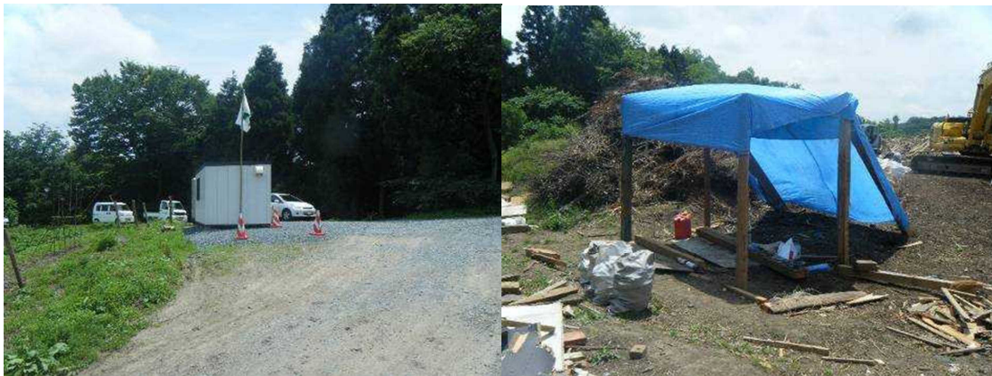
仮置場入口付近に設けられた待機所 (柱はガレキの一部を有効利用)

【取組1】宮城県松島町では、仮置場の入口付近に現場作業従事者が待機、休息するためのプレハブ小屋を設置し、水分補給を行うための設備、救急医療器具・薬品 及び手を洗う等の清潔維持のための設備を備えています。待機所には安全旗を掲揚して、作業従事者に対して安全作業遵守を喚起しています。加えて、作業現場付近に、直射日光を避けつつ、短時間の休息を取ることと併せ水分補給を行うための設備を設けています。内部には、眼への異物混入、怪我をした際の傷口洗浄のためのペットボトル、ポリタンクの水等を備えています。