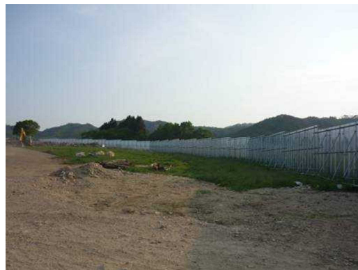
仮置場周囲に設置されたフェンス (岩手県田野畑村)

【効果】 仮置場からの紙ごみなどの飛散を防止することにより、周辺環境の悪化防止する効果が期待されます。