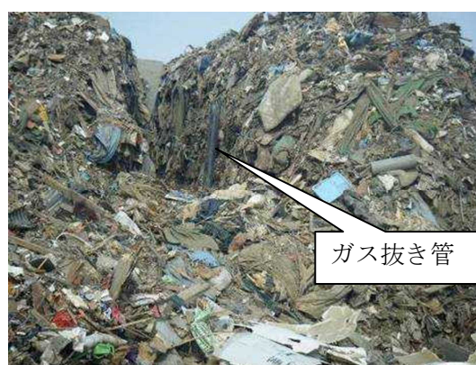
混合物の山に設置されたガス抜き管

【効果】 現場にて目視確認を行ったところ、ガス抜き管からは、湯気が噴き出しており、内部において、発熱と微生物発酵が進行していることが予測されました。このようなガス抜き管の設置によって、火災発生の抑制に効果が見込めるものと考えられます。