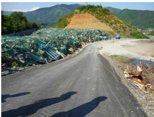
ネットで覆われた災害廃棄物 (岩手県大船渡市)

【取組】 岩手県大船渡市では、紙ごみやプラスチックごみなどの敷地外への飛散防止を図ることを目的として、仮置場にフェンスを設置するとともに、保管された災害廃棄物全体をネットで覆っています。また、岩手県田野畑村では仮置場の周囲に十分な高さのフェンス(3m)を設置し、ごみの飛散防止を図るとともに、仮置場区画の明確化、外部からの侵入防止を図っています。