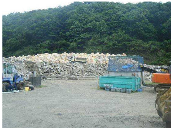
フレコンバックを用いて保管された肥料

なお、飼料、肥料の防湿を図る手段としては、このほか、保管場所の屋根の設置やブルーシート等による養生が考えられますが、この場合、水溜まりの発生防止や強風時における飛散防止のための対策を講じる必要があります。