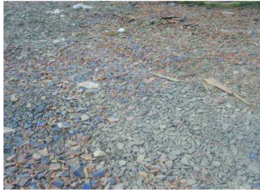
屋根瓦で覆われた仮置場敷地 (宮城県七ヶ浜町)

【効果】 仮置場の搬入路を整備することにより、粉じんの発生・飛散による作業環境及び周辺環境の悪化を防止することが期待されます。