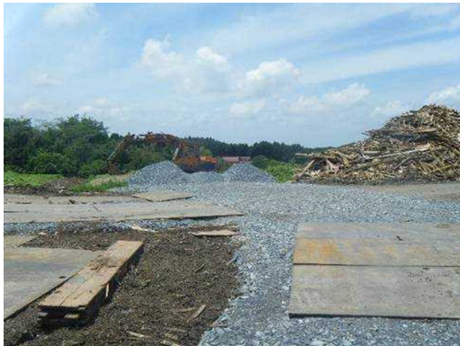
仮置場搬入路に敷設された砂利・鋼板 (宮城県松島町)

【取組】 宮城県松島町では、仮置場の搬入路に鉄板や砂利などを敷くことにより乾燥時における粉じんの飛散を防止する取組がなされています。また、宮城県七ヶ浜町では、砕いた屋根瓦を仮置場敷地内に敷設して同様の効果を得ています。