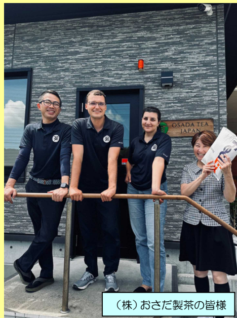
（株）おさだ製茶の皆様