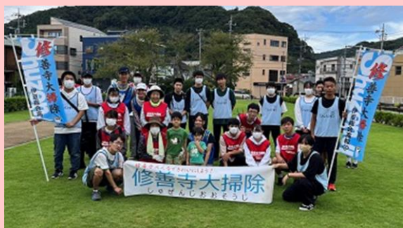
静岡県立伊豆総合高等学校 生徒会 (伊豆市)

生徒会が主体となり、10年以上にわたり毎月の地域の清掃活動を継続。地域の高齢者から子どもまで幅広い年齢層の人々が清掃活動に参加し、地域住民が交流する機会となっている。清掃活動を通し、明るく住みやすい地域作りに貢献している。