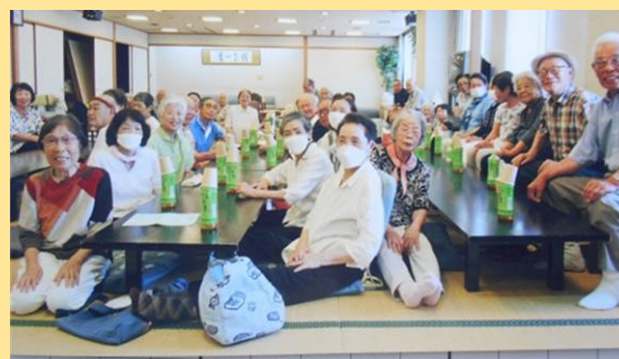
シニアクラブ江尻 (静岡市清水区)

学校教育に長年携わり、子どもたちの教育活動の推進を支えている。また、コミュニティ・スクールでは学校と地域をつなげる橋渡し役を担っている。児童の地域学習の際には、地域の知識を伝え、安全を見守るなど学校に無くてはならない存在である。