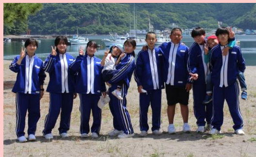
沼津市立戸田小中一貫学校 自治会 (沼津市)

学校自治会が主体となり、御浜岬の海岸美化活動を継続。地域の環境美化委員やこども園などと一緒に活動し、学校と地域の連携強化にもつながっている。観光スポットの清掃活動を行うことで子どもたちの郷土愛を育てる活動となっている。