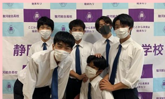
有志団体 US (静岡県立駿河総合高等学校) (静岡市駿河区)

駿河総合高等学校の生徒6人のメンバーで、「地域貢献」をキーワードに災害支援活動等に取り組んでいる。授業で学んだSDGsの知識を生かし、企業と協力し独自性のある活動を継続。幅広い年齢層に対応した活動は、地域の人々から大変喜ばれている。