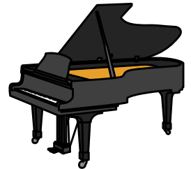
ピアノ出荷量の推移

平成26年の静岡県のピアノの出荷台数は35,174台、出荷額は230億4,800万円でいずれも 日本一 であり、その全国に占める割合はなんと 100% ！日本国内でピアノを出荷しているのは、 静岡県だけとなります。