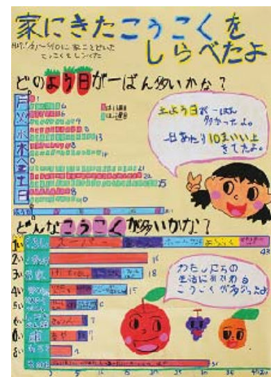
<静岡県知事賞：第 1 部>