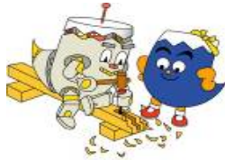
ふじっぴー静岡県